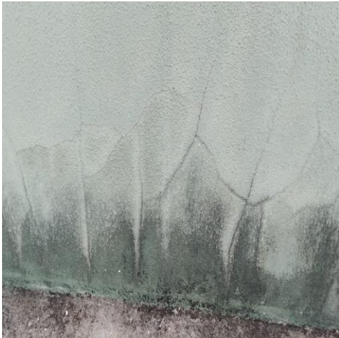
Figura 13: Mofo e fissuras na parede externa.