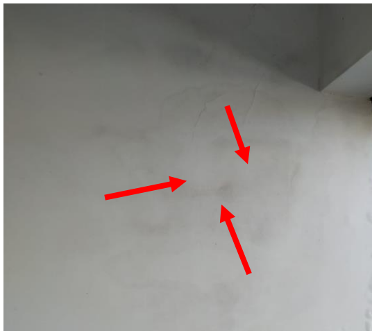
Figura 04: Mancha de umidade e fissura.

De acordo com a figura 04, também podem surgir fissuras devido a umidade, onde Medeiros e Franco (1999) classificam as fissuras como internas que são provocadas pela ação de variação térmica e umidade, provocando movimentações de contração e expansão que dependem das propriedades do material, e as externas, causadas por cargas transmitidas pelos elementos estruturais e movimentos diferenciais entre os elementos de concreto armado e as paredes.