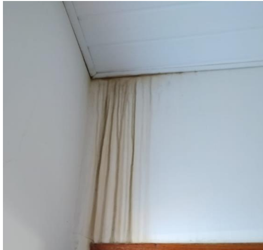
Figura 10: Infiltração no teto de PVC.

mudança dos moradores para o imóvel. Devido à chuva, aparecem goteiras que provocam esse problema com a umidade, pois a água circula até encontrar uma abertura.