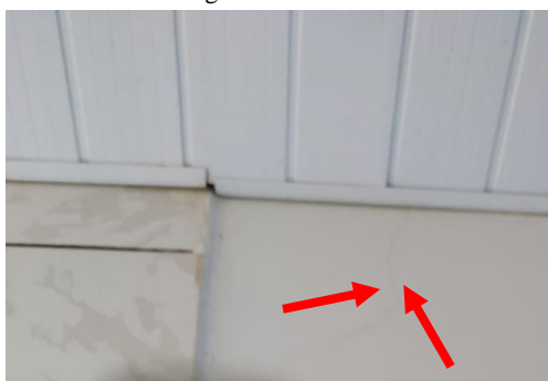
Figura 09: Fissura.

Na figura 09, mostra uma fissura presente por 4 anos depois que os moradores residem, que vai do teto até a parede podendo ser ocasionada pela dilatação térmica, tendo a mesma solução dos mofos e fissuras anteriores, como retirar a pintura e refazer usando impermeabilizante para evitar a infiltração nesse local.