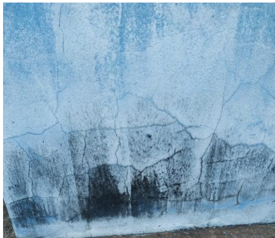
Figura 07: Mofo e fissuras na parede externa.

Não foram feitas medidas, apenas pelas visitas e observações, as fissuras se dão devido às movimentações da estrutura decorrentes de variação climática, recalques de fundações, ou qualquer outro fenômeno a que a construção seja submetida. Quando isso acontece, as fissuras passam a ser porta de entrada para a infiltração e percolação de água.