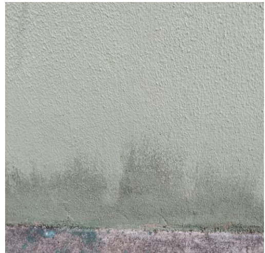
Figura 14: Infiltração.