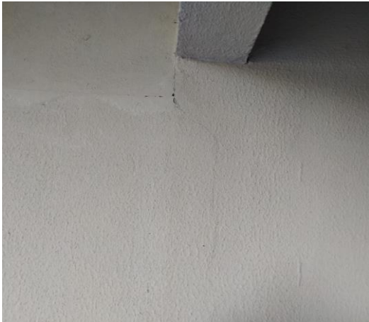
Figura 11: Fissura na parede.