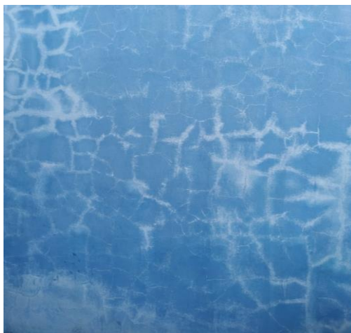
Figura 08: Eflorescência na parede externa.