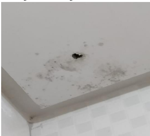
Figura 06: Mofo e goteira no teto do banheiro.

A figura 06 apresenta infiltração de água no teto do banheiro, podendo ser causada por uma pequena rachadura na laje ou problema de deslocamento na telha, e pouco a pouco, pode corroer o material do revestimento ou do forro causando um mal maior.