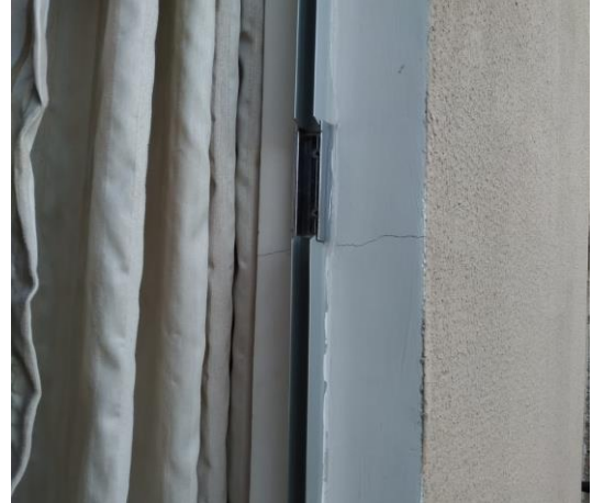
Figura 12: Fissura no requadro da janela.