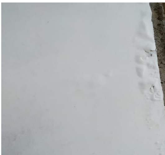
Figura 05: Mofo, empolamento e descascamento da pintura.