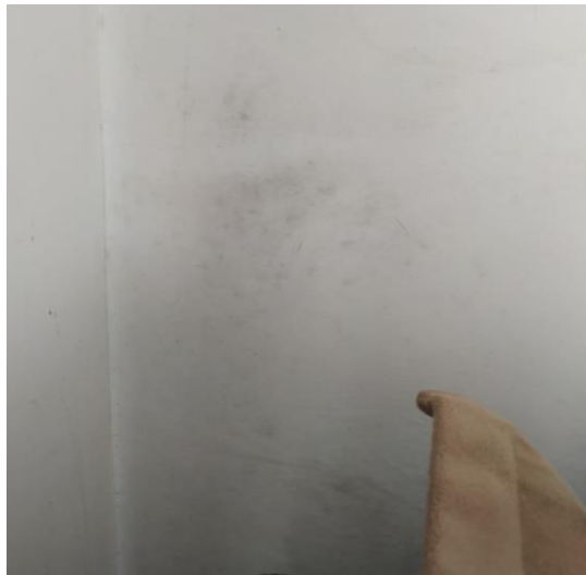
Figura 03: Mancha de umidade.

Foram encontradas algumas irregularidades. Uma delas, como mostra a figura 03, é uma mancha de mofo encontrada na parede da sala, que segundo os moradores estão com esse problema há 1 ano e não fizeram nenhum reparo.